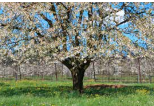
Schnitt und gute Pflege der Obstbäume sind Basis für feine Destillate.

7 | Société Coopérative de Distillerie de Bougy , Féchy, Telefon: 021 545 85 25 Schaubrennen, Kohl-Treberwurst von 11:00 bis 14:30 h (Reservation obligatorisch)